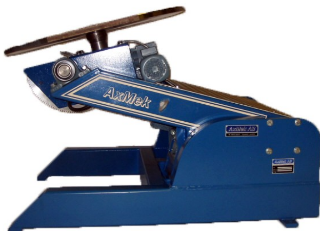
Steglös inställning av alla lägen