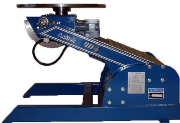
Steglös inställning av alla lägen